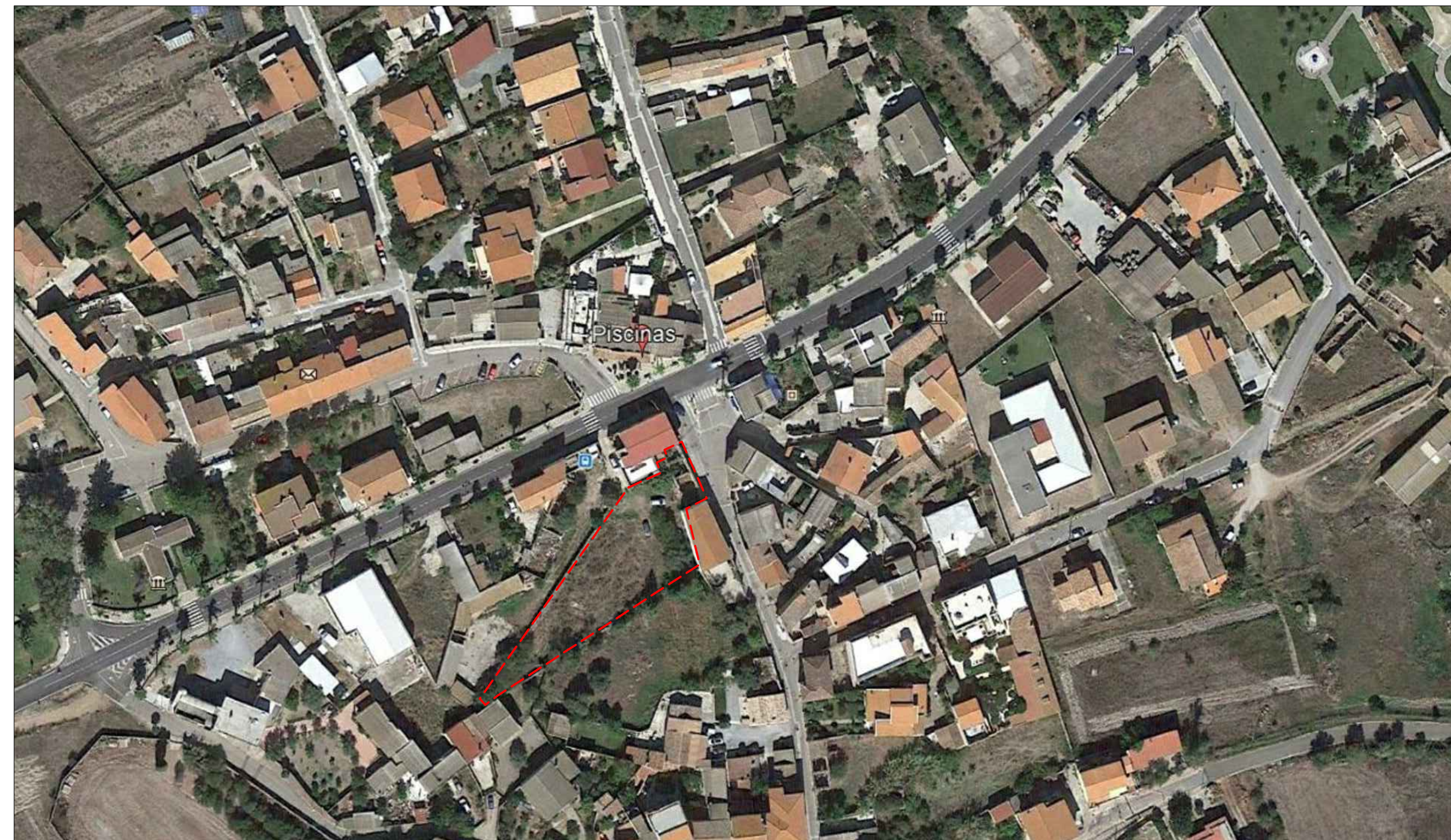
Ubicazione area intervento