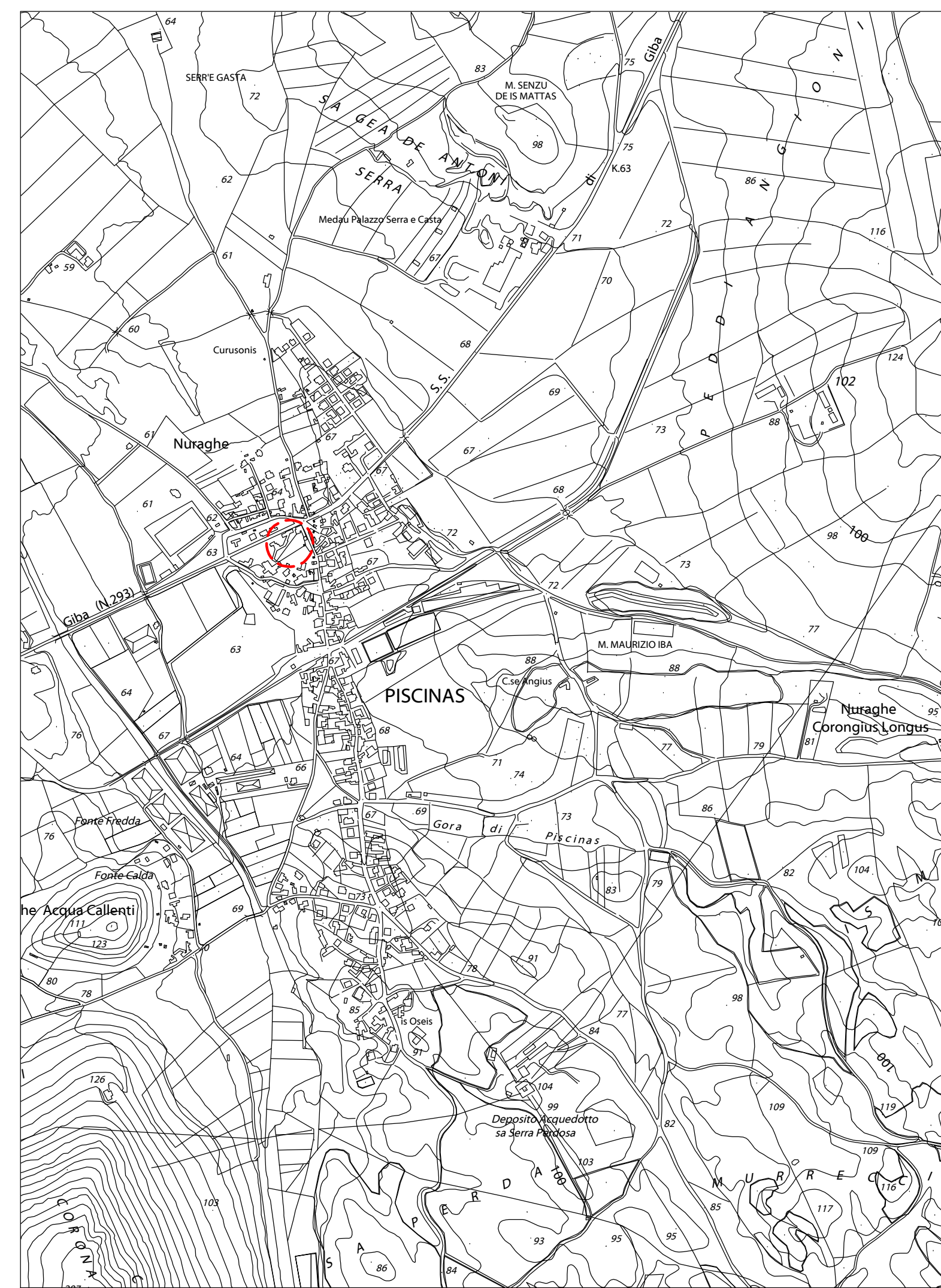
Stralcio CTR - Scala 1:10000