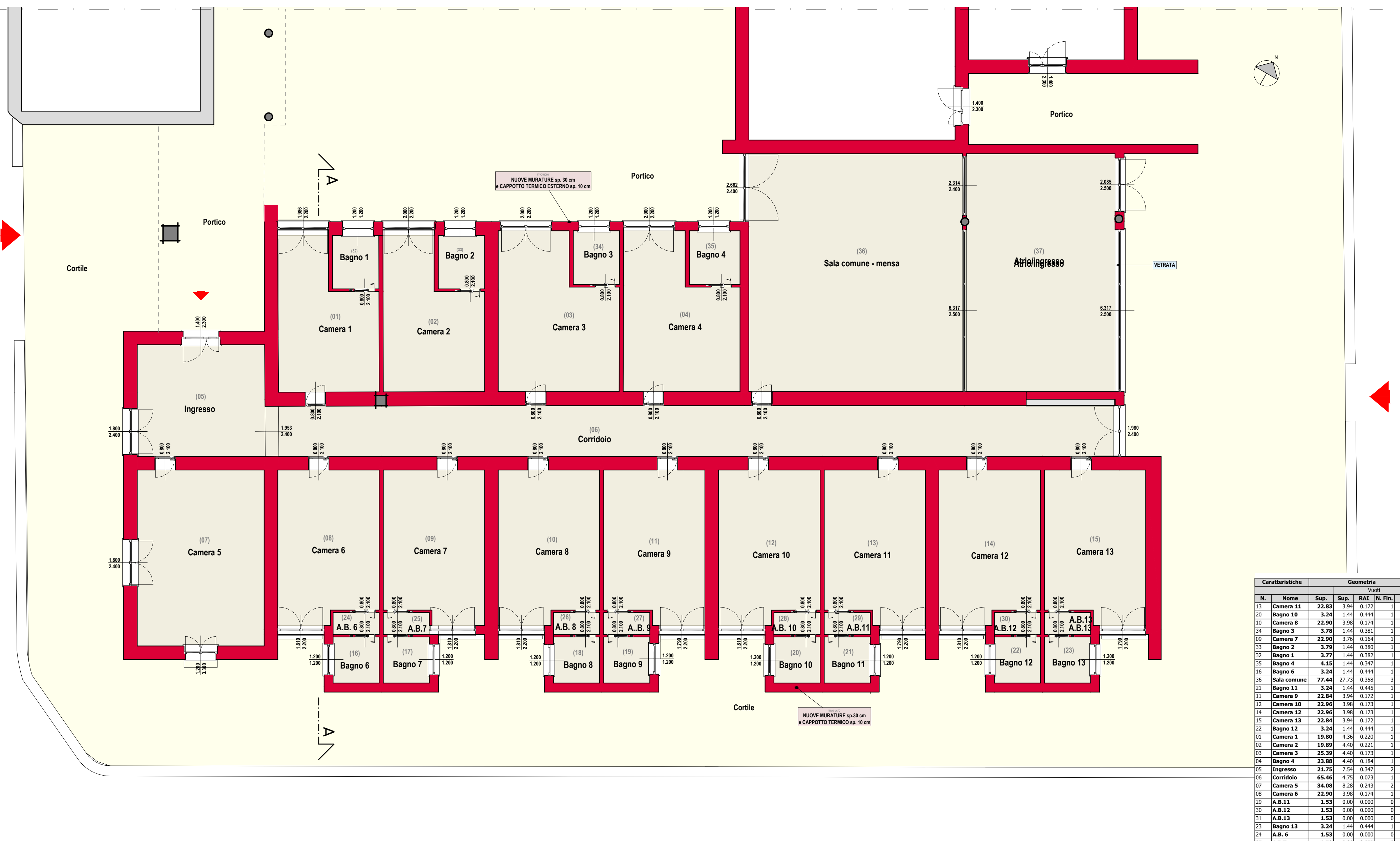
PIANTA DEL PIANO TERRA