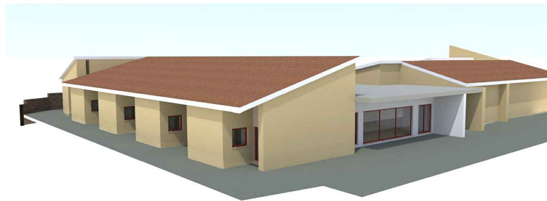
BOZZA DELL'IPOTESI DI PROGETTO